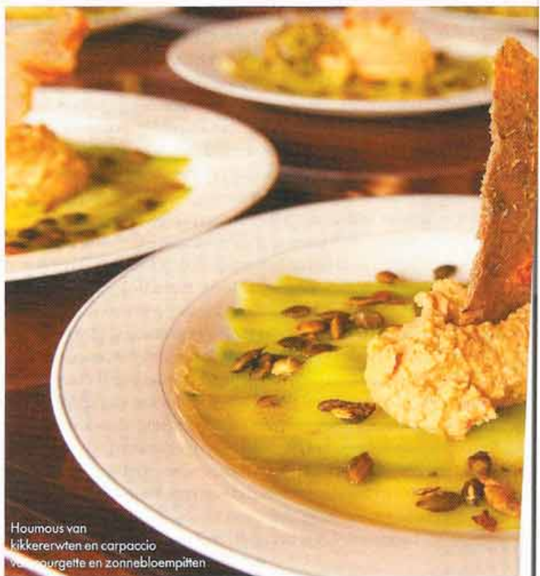
Houmous van kikkererwten en carpaccio van courgette en zonnebloempitten

LAAT JE VOEDING JE MEDICIJN, EN JE MEDICIJN JE VOEDING ZIJN