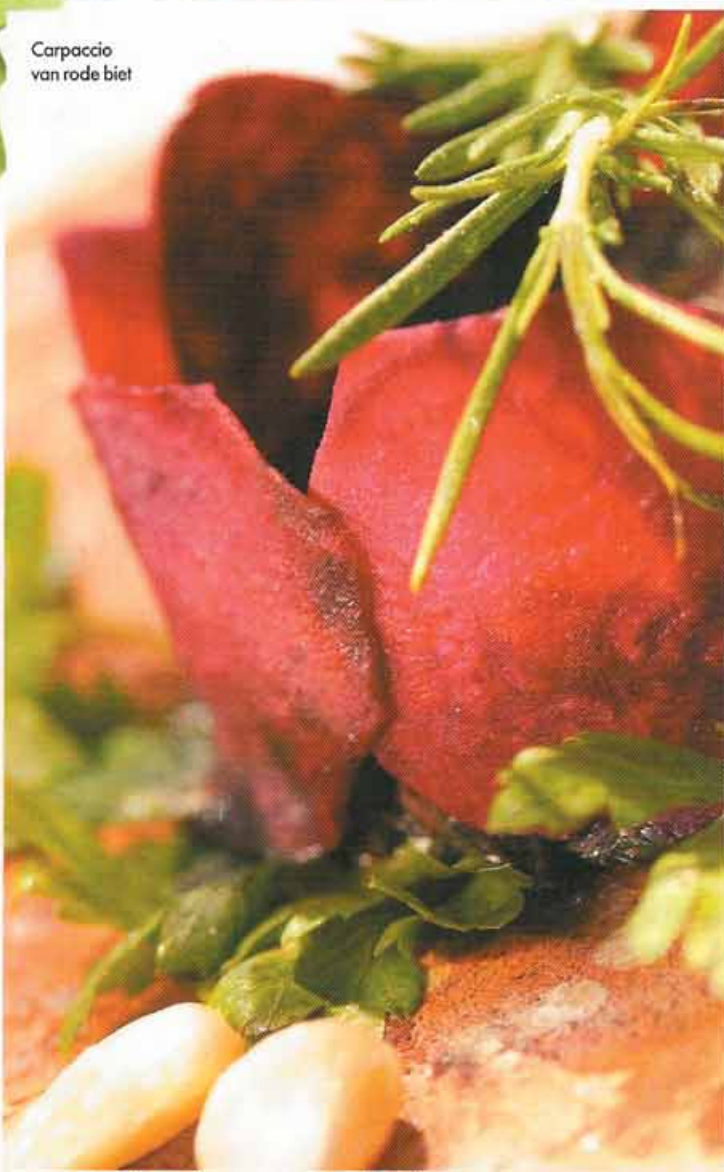
Carpaccio van rode biet

7 Vermijd energievreters: opwekkende middelen zoals koffie, alcohol, koolzuurhoudende dranken en snelle suikers jagen je insuline de hoogte in waardoor je een opstoot van energie krijgt die even snel weer naar beneden duikt. Zo kom je op een roetsjbaan terecht tussen hyperglycemie (agressiviteit) en hypoglycemie (moeheid, concentratieproblemen). Trage suikers geven een constante energievoorraad en verhogen het uithoudingsvermogen.